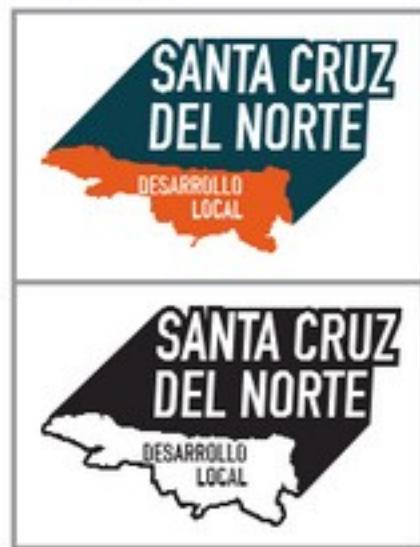
Ref. 9 Variante óptima