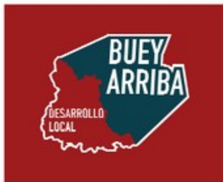
Ref. 12. Aplicación sobre fondos de color o imágenes