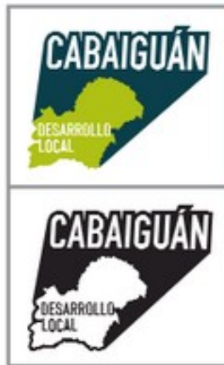
Ref. 9. Variante óptima