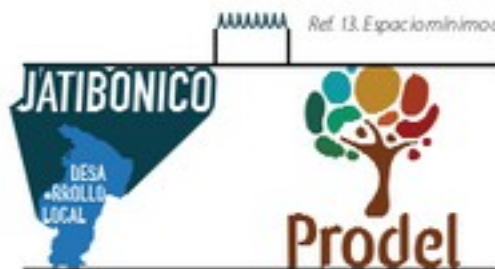
Ref. 13. Espacio mínimo de convivencia

En el caso de convivir con otros identificadores se deberá tomar como referencia mínima, ocho veces el ancho la letra 'A' del genérico para determinar el área de respeto que debe mantenerse entre un identificador y otro (Ver Ref. 13).