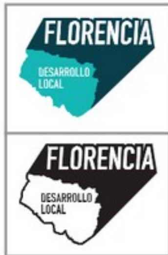
Ref. 9. Variante óptima