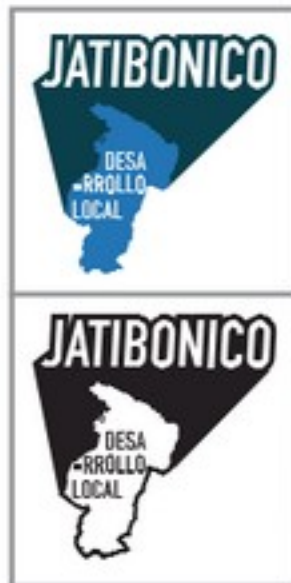
Ref. 9. Variante óptima